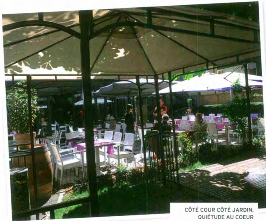
CÔTÉ COUR CÔTÉ JARDIN, QUIÉTUDE AU COEUR DE GENÈVE.

N° de thème: 284.46 N° d'abonnement: 1092286 Page: 82 Surface: 118'762 mm 2