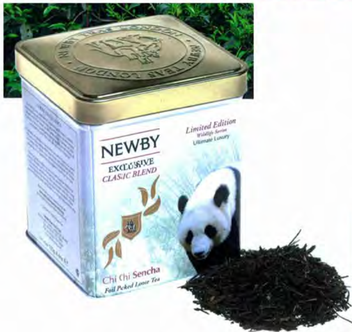
NEWBY, MARQUE ROMANDE DE THÉS, FAIT LE BONHEUR DES AMATEURS DE BOISSONS «NOUVELLE TENDANCE».

extrêmement bien centré. Pas de voiture à l'horizon, seulement de magnifiques marronniers et un barbecue installé à l'extérieur qui permet aux clients de commander leurs grillades. On peut y accueillir jusqu'à 70 personnes. De plus, il est possible de le privatiser pour un mariage, un anniversaire, une soirée d'entreprise ou autre.